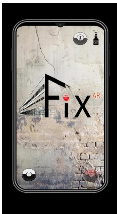
Εικόνα 1: Στιγμιότυπο από τη διεπαφή χρήστη της εφαρμογής FIX

Όλες οι εφαρμογές υλοποιήθηκαν για περιβάλλον android, χρησιμοποιώντας την πλατφόρμα Unity. Για τη σάρωση των markers χρησιμοποιήθηκε το λογισμικό επαυξημένης πραγματικότητας Vuforia και για τον γεω-εντοπισμό του χρήστη χρησιμοποιήθηκε η πλατφόρμα ανοιχτού κώδικα mapbox.