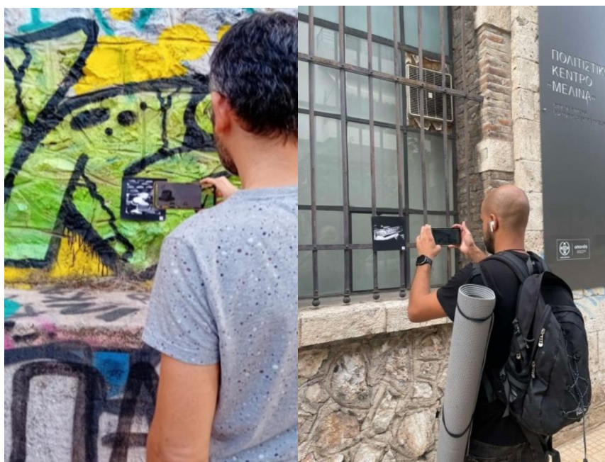
Εικόνα 3: Σκανάροντας markers στην εφαρμογή Πιλ-Πουλ

Αυτή η πολυεπίπεδη και ταυτόχρονα ενιαία νοηματικά λειτουργία του βίντεο επιτρέπει στο δημιουργό να επικεντρωθεί αποτελεσματικότερα στο σχεδιασμό του ψηφιακού περιεχομένου και της εμπειρίας του αφενός, και αφετέρου, ωθεί τον χρήστη να γνωρίσει, να κατανοήσει και να ανταποκριθεί ευκολότερα στο ψηφιακό περιεχόμενο. Η χρήση της προφορικής αφήγησης σε συνδυασμό με τις κινούμενες οπτικές αναπαραστάσεις οδηγεί σε βαθύτερη κατανόηση σε σχέση με τον συνδυασμό κειμένου και εικόνας σε οθόνες, καθώς η πληροφορία κατανέμεται σε διαφορετικά κανάλια επεξεργασίας (οπτικό και ακουστικό) αποφεύγοντας την υπερφόρτωση ενός μόνο καναλιού (Mayer 2009, σ. 200-220). Στο πλαίσιο αυτό, η ενσωμάτωση οπτικών, αφηγηματικών και ηχητικών δομών σε βίντεο, δεν αποτελεί απλώς αισθητική επιλογή αλλά, όπως υποστηρίζουν και οι Aziz κ.ά. (2024), προσφέρει στον χρήστη μια πολυαισθητηριακή και εμπυθιστική εμπειρία που προκαλεί εντονότερα συναισθήματα και καλλιεργεί μια βαθύτερη σύνδεση με το ψηφιακό περιεχόμενο.